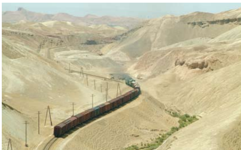
Province de Khatlon, Tadjikistan méridional : la vétusté de l'infrastructure ferroviaire, du matériel roulant et des installations de changement de bogies entrave le commerce international de l'Asie centrale.

« Il est vraiment difficile pour les entreprises locales de